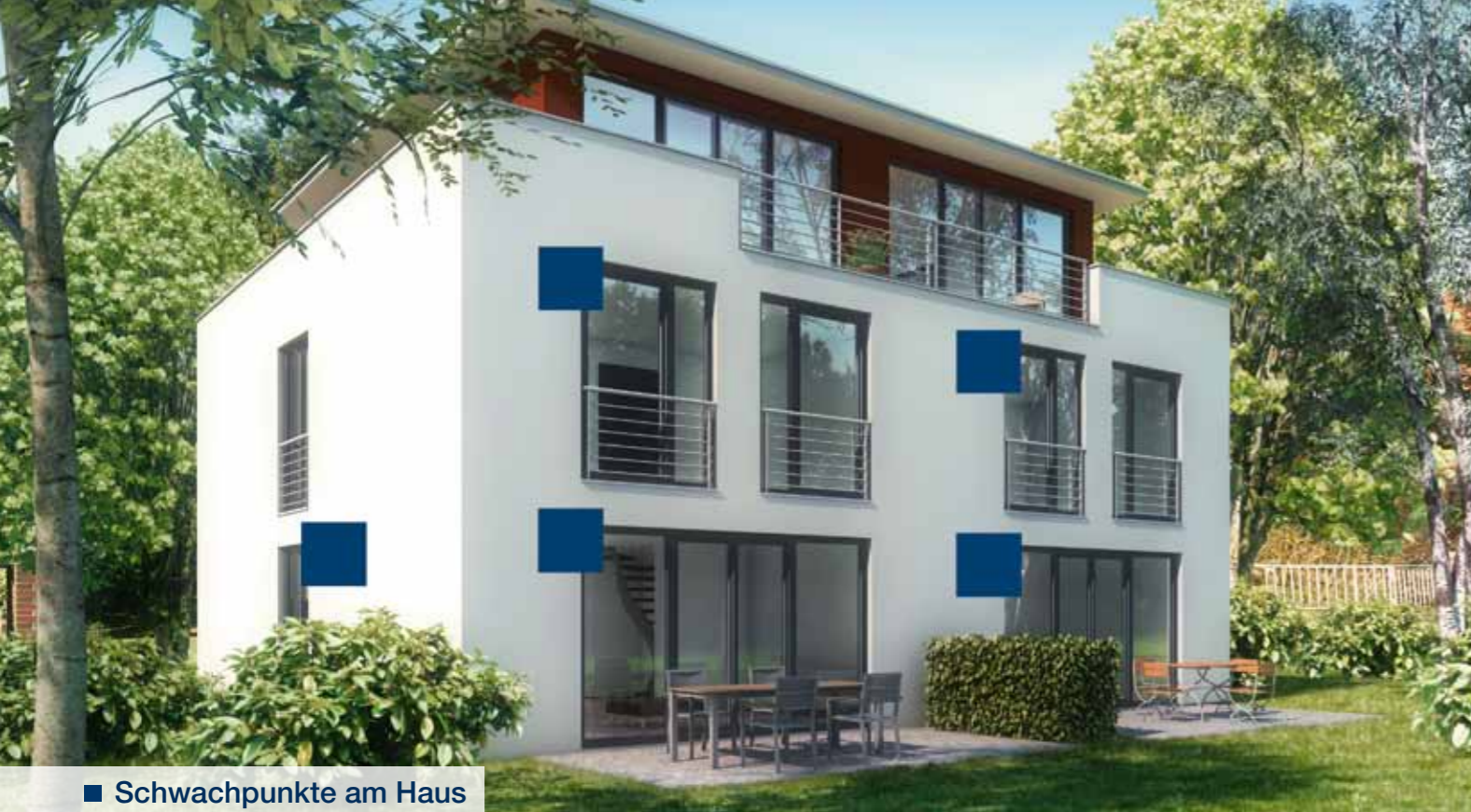
■ Schwachpunkte am Haus

Der stahlharte TRESOR-RIEGEL wird im unteren Bereich des Fensters verbaut und verriegelt im Stahlkäfig des Fensterflügels. Die geniale Kombination aus TRESOR-RIEGEL und 8-Kant-Verschlussbolzen vereiteln Einbruchsversuche bereits im Ansatz durch einen Aushebelschutz von bis zu einer 1/2 Tonne . Diese einzigartige Technologie hindert Einbrecher effektiv am Eindringen in Ihr Haus und schützt Sie somit auf höchstem Niveau.