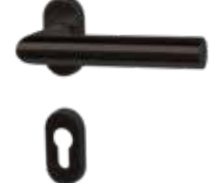
Modell V10 Schwarzstahl