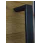
Griffstange Schwarzstahl Länge: 1500mm