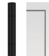
Rollenbänder EV1 / Schwarz oder verdeckte Bänder